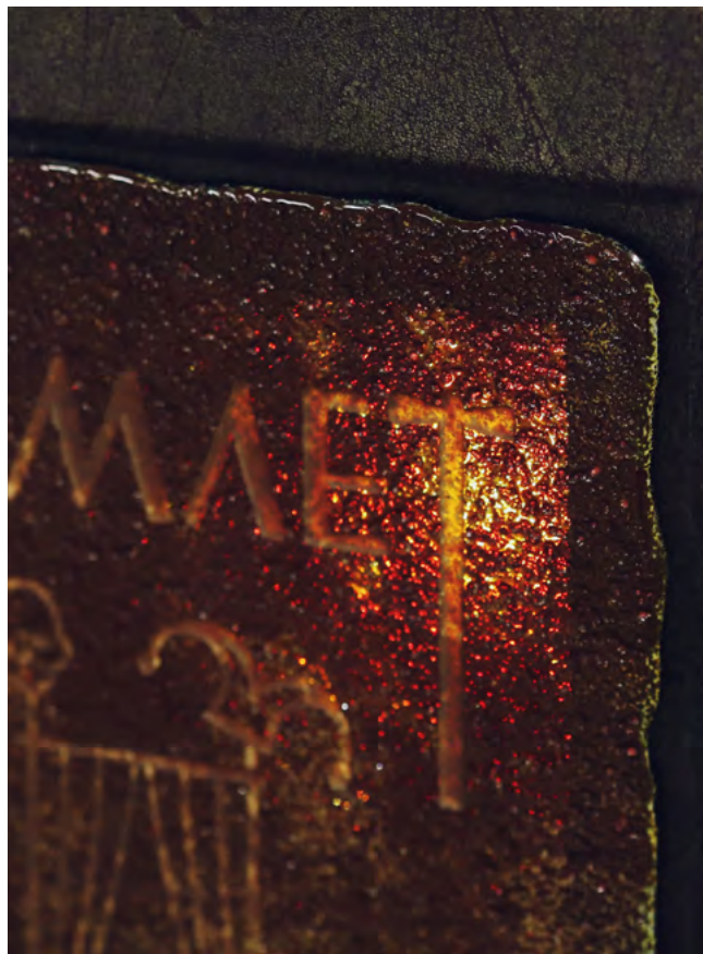
ДЕТАЛЬ: На передней крышке переплёта — вставка из стекла кроваво-красного цвета, на которой выгравированы трон, шпага, кубок, череп и шутовской колпак.

Каждый экземпляр пронумерован и подписан художником и издателем. Экземпляр № 1 хранится в собрании Государственного Эрмитажа.