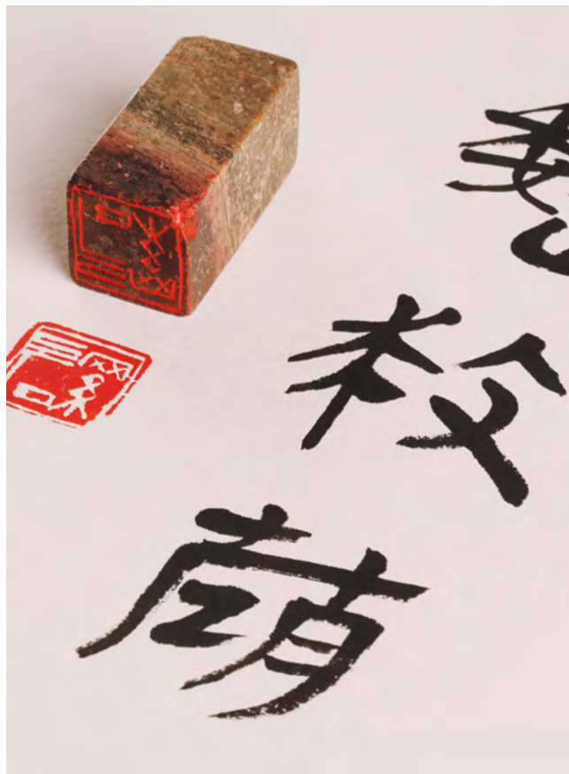
ДЕТАЛЬ: Названия каждой стратагемы на китайском языке выполнил признанный мастер каллиграфии Ло Лэй.

Каждый экземпляр пронумерован и подписан художниками и издателем. Экземпляр № 21 хранится в собрании Государственного Эрмитажа.